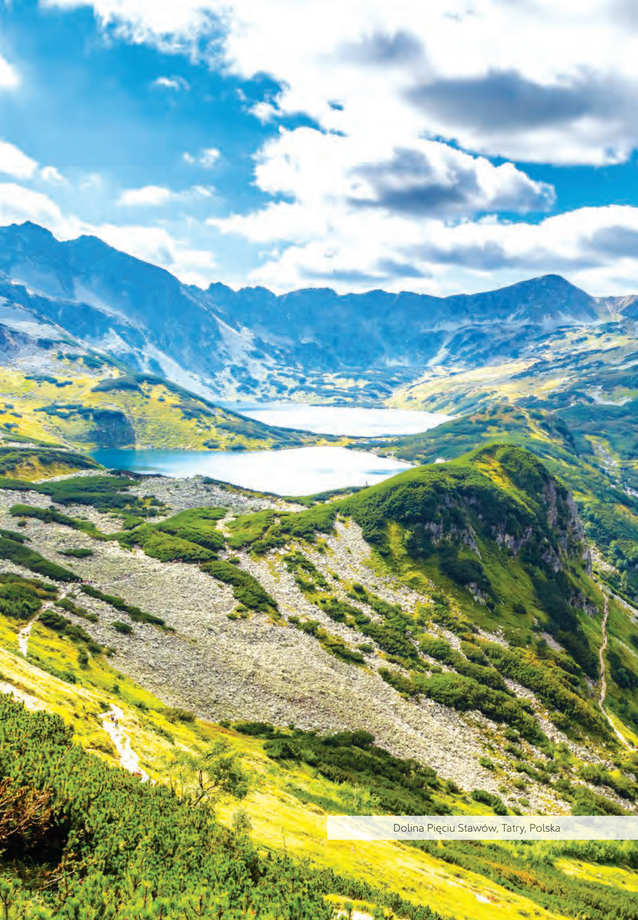
Dolina Pięciu Stawów, Tatry, Polska