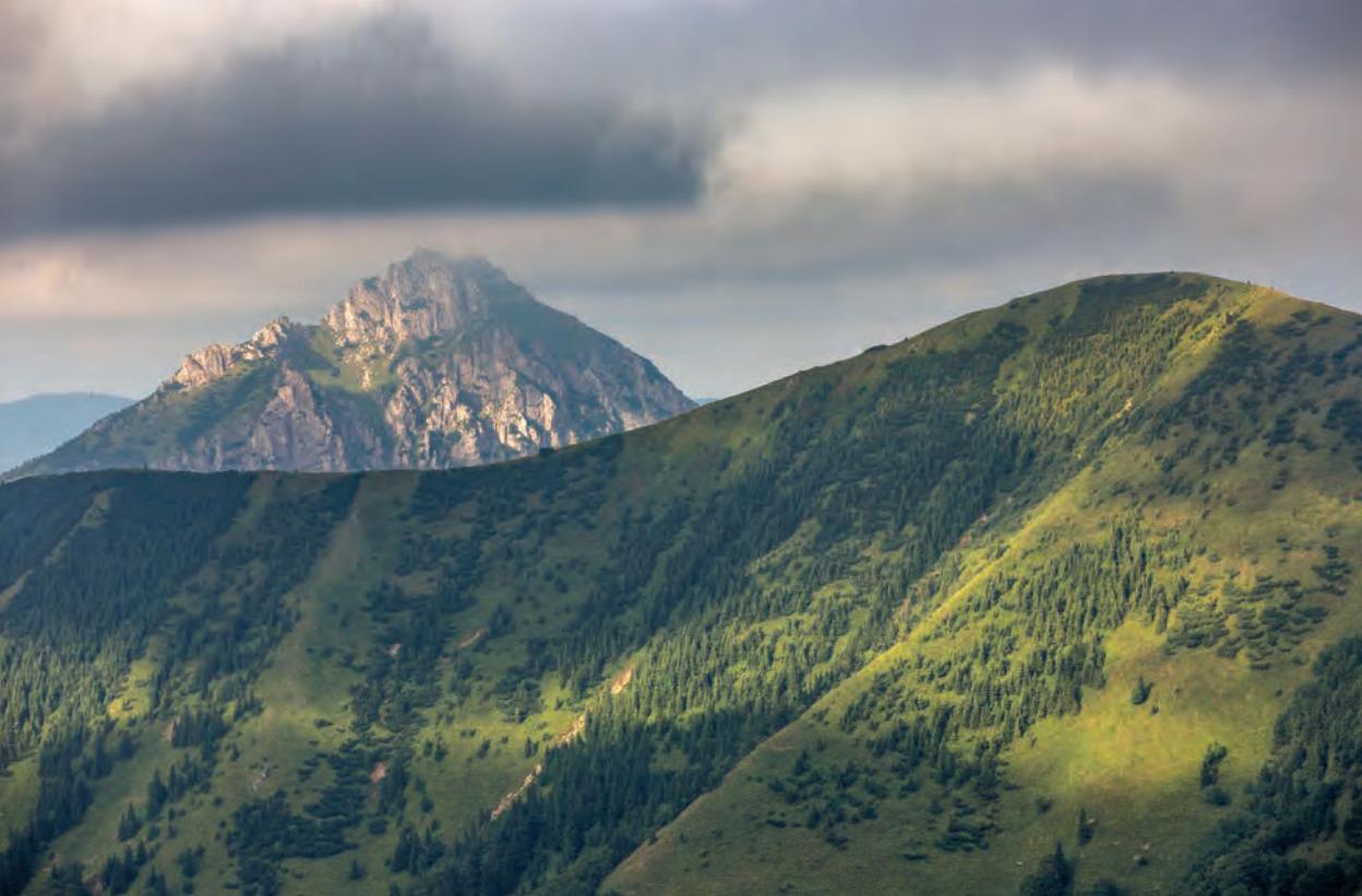
Pasma górskie Mała Fatra, Słowacja

wymiany młodzieży, Ramowa Konwencja o ochronie i zrównoważonym rozwoju Karpat, Instytut Karpacki, Beskidzkie Centrum Narciarstwa. Będziemy działać w kierunku upowszechnienia turystyki służącej komunikacji międzykulturowej oraz budowaniu mocnych więzi między wspólnotami lokalnymi. Za niezbędne uważamy więc rozbudowę przejść granicznych oraz tworzenie nowych. Opowiadamy się za wpisaniem na Listę Światowego Dziedzictwa UNESCO transgranicznych fortyfikacji austro-węgierskich, w tym Twierdzy Przemyśl. Chcąc wzmocnić współpracę w regionie, opowiadamy się za organizacją konferencji karpackich grup parlamentarnych oraz karpackiego forum gospodarczego.