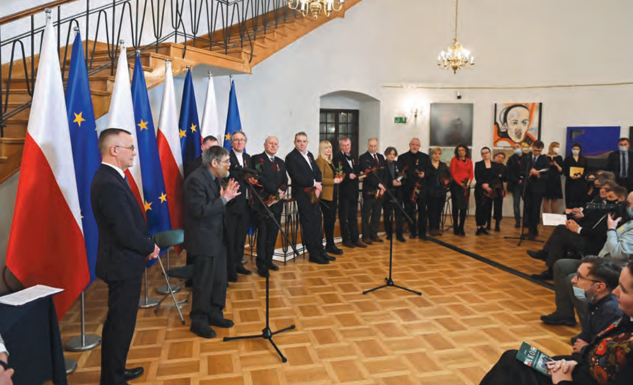
Uroczystość wręczenia medali i odznaczeń zasłużonym twórcom i ludziom kultury, Krasiczyn, 5 lutego 2022 r.

Pełnił funkcję redaktora m.in. gazety strajkowej „Trwamy”, miesięcznika „Z Dołu” czy wydawnictw „Busola” i „Strych Kulturalny”. Był też publicystą roczników „Dialog Dwoch Kultur” i „Studia Leopoliensia”.