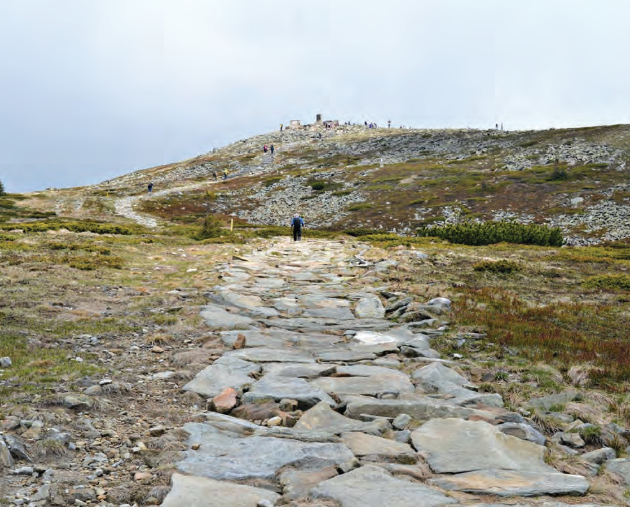
Szlak na Babią Górę, Beskid Żywiecki, Polska

tylko Polski, lecz także Europy. Jest to na pewno nowa forma ekologicznej walki o rzeki Europy i nowa forma edukacji ekologicznej. Źródło Wisły znajduje się na stoku Baraniej Góry w Beskidzie Śląskim w Karpatach Zachodnich.