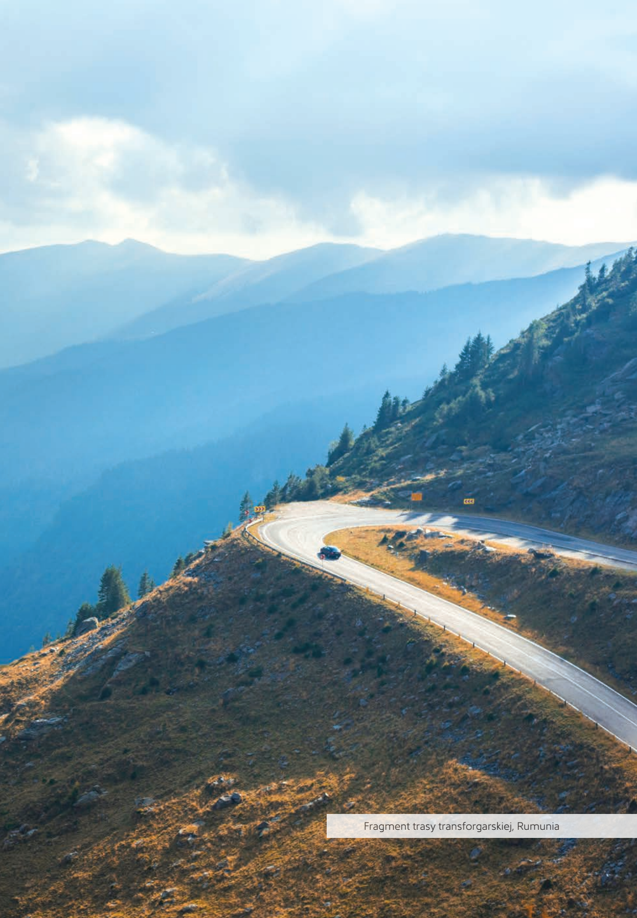
Fragment trasy transforogarskiej, Rumunia