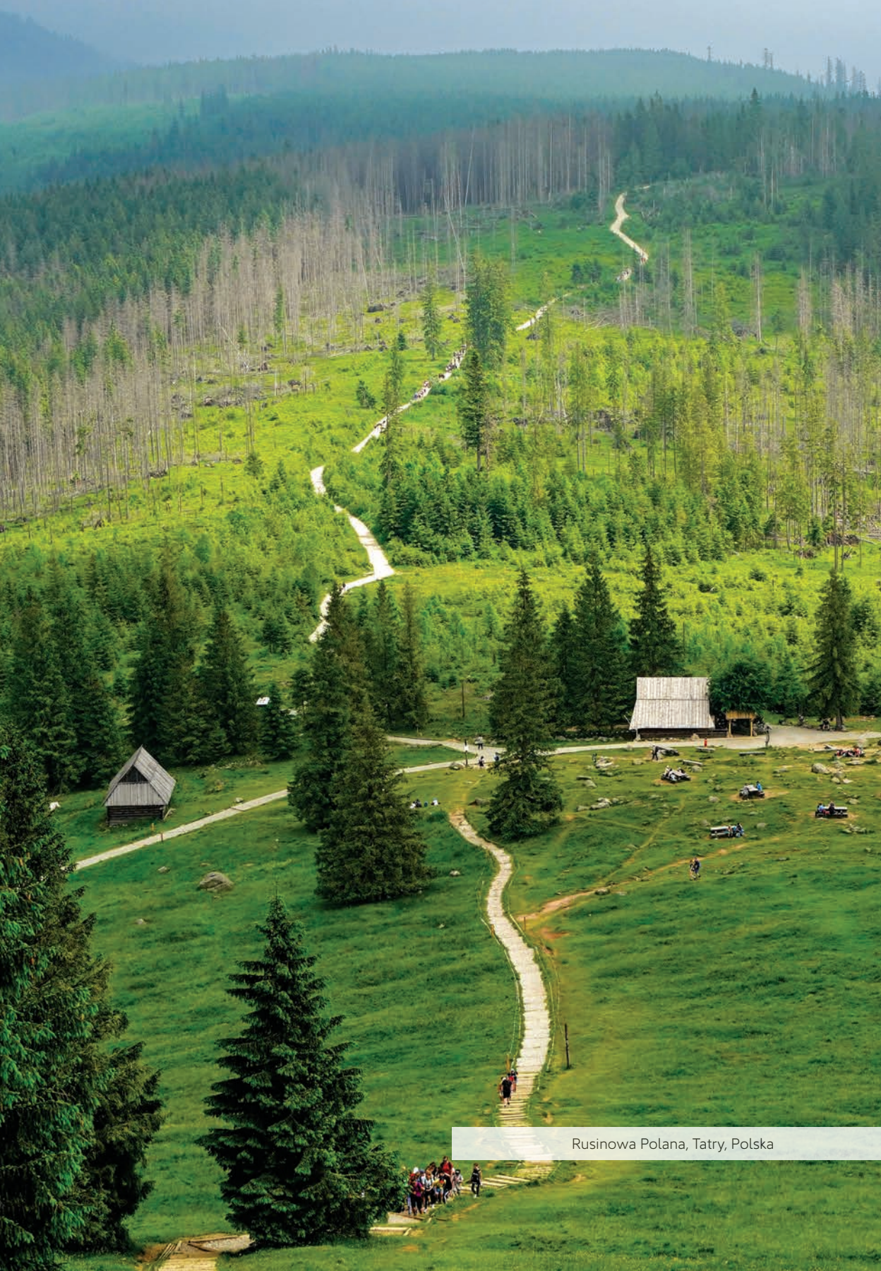
Rusinowa Polana, Tatry, Polska