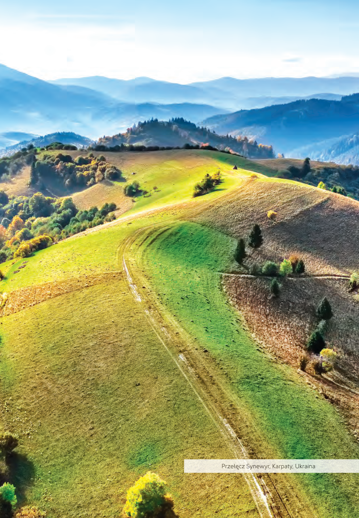
Przetęcz Synewyr, Karpaty, Ukraina