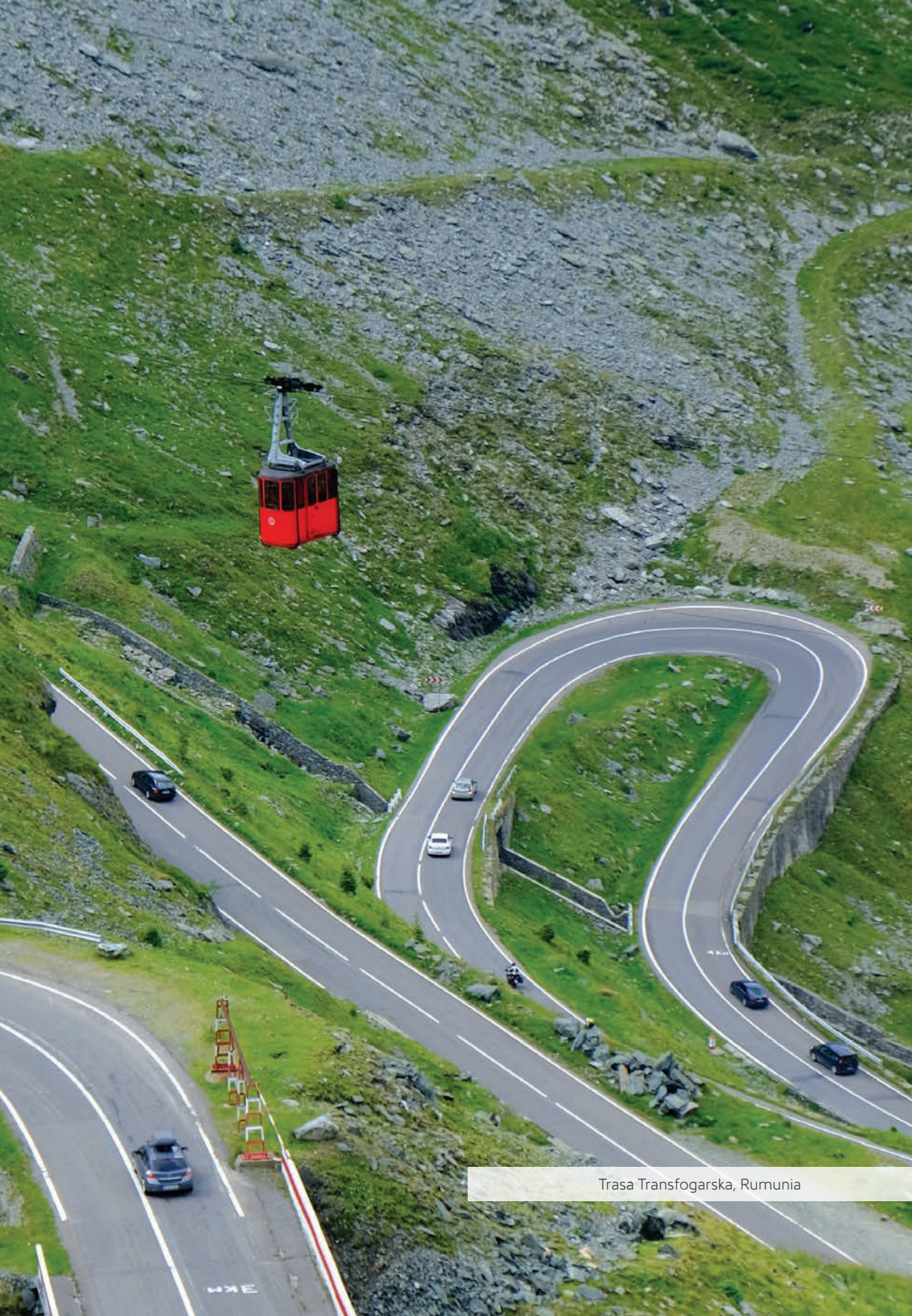
Trasa Transfogarska, Rumunia