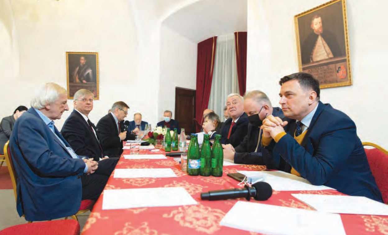
Spotkanie inicjujące działalność Międzynarodowego Klubu Europy Karpat, Krasiczyn, 4 lutego 2022 r.