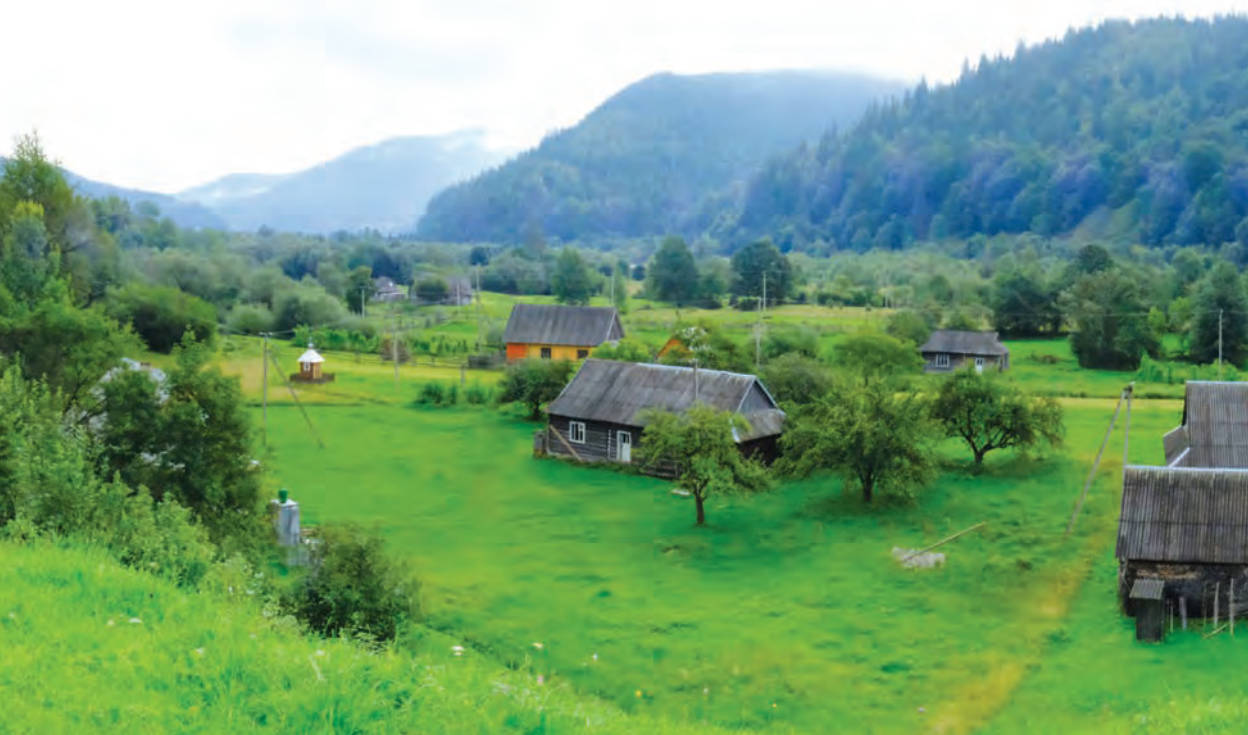
Pasma górskie Gorgany, Beskidy, Ukraina

mogłyby stać się osnową merytorycznej współpracy nad szczegółowymi zagadnieniami z zakresu infrastruktury, środowiska, gospodarki czy też kultury.