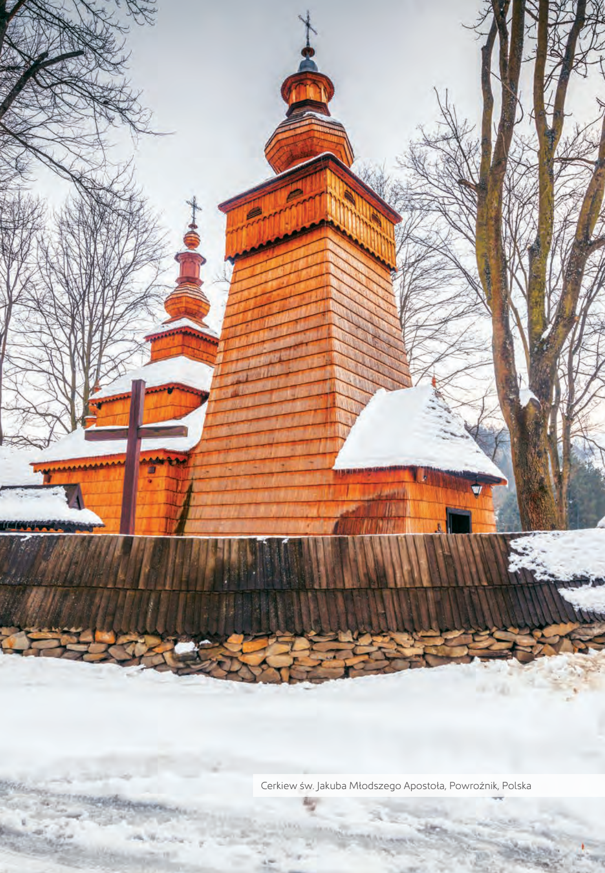
Cerkiew św. Jakuba Młodszeo Apostoła, Powroźnik, Polska