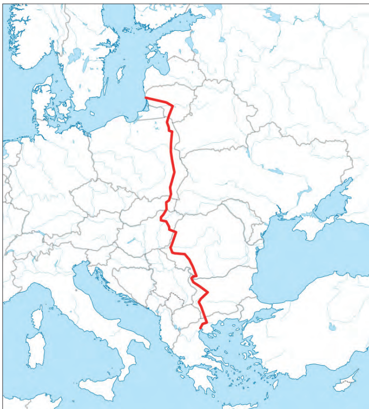
Trasa Via Carpatia

w Salonikach. Planowana długość szlaku to ok. 3500 km. Dla wygody turystów jest on podzielony na segmenty – zgrupowania obiektów zabytkowych i przyrodniczych – które można zwiedzać niezależnie od całego szlaku. Ważnym zastrzeżeniem przy kwalifikacji obiektów jest konieczna bliska odległość do całodobowych ambulatoriów ogólnych i stomatologicznych. Kolorem szlaku jest karmazyn, stąd angielska nazwa Crimson Route.