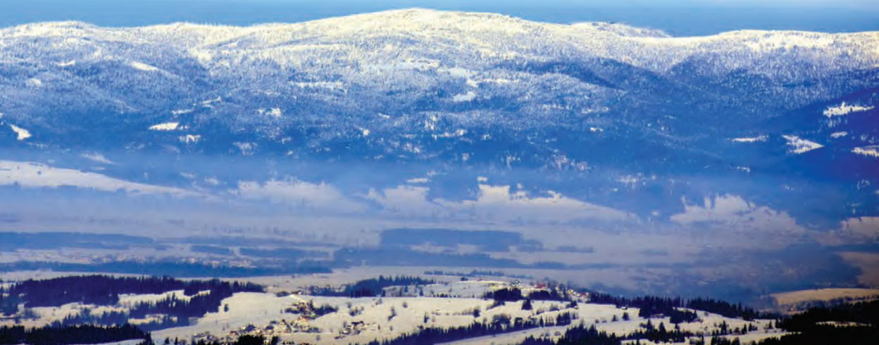
Zima na Turbaczu, Gorczański Park Narodowy, Polska