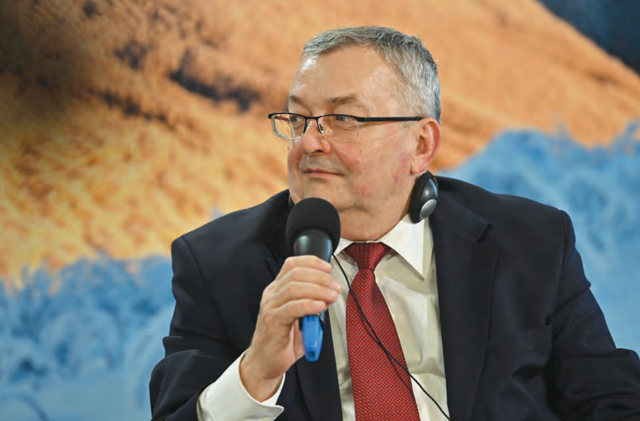
Andrzej Adamczyk – minister infrastruktury RP

w Radzie UE i w zakresie transportu będzie finalizować sieć TEN-T. Wiceminister mówił również o potrzebie rozmów z Ukrainą w kwestii połączeń z siecią TEN-T, aby harmonizacja planów była łącznikiem w wymiarze strategicznym. Dodał także, że Partnerstwo Wschodnie powinno przekładać się na konkretne infrastrukturalne programy.