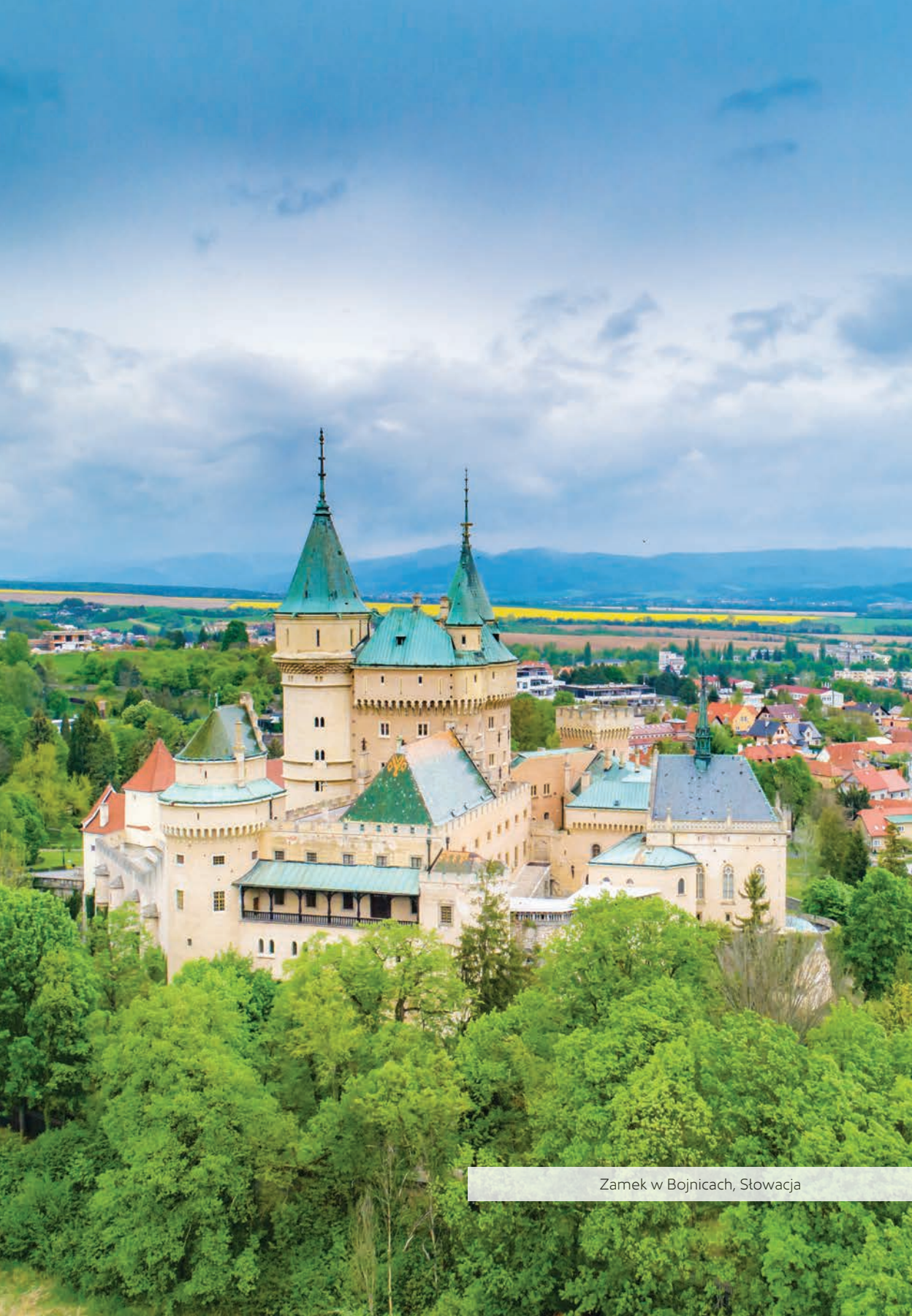
Zamek w Bojnicach, Słowacja