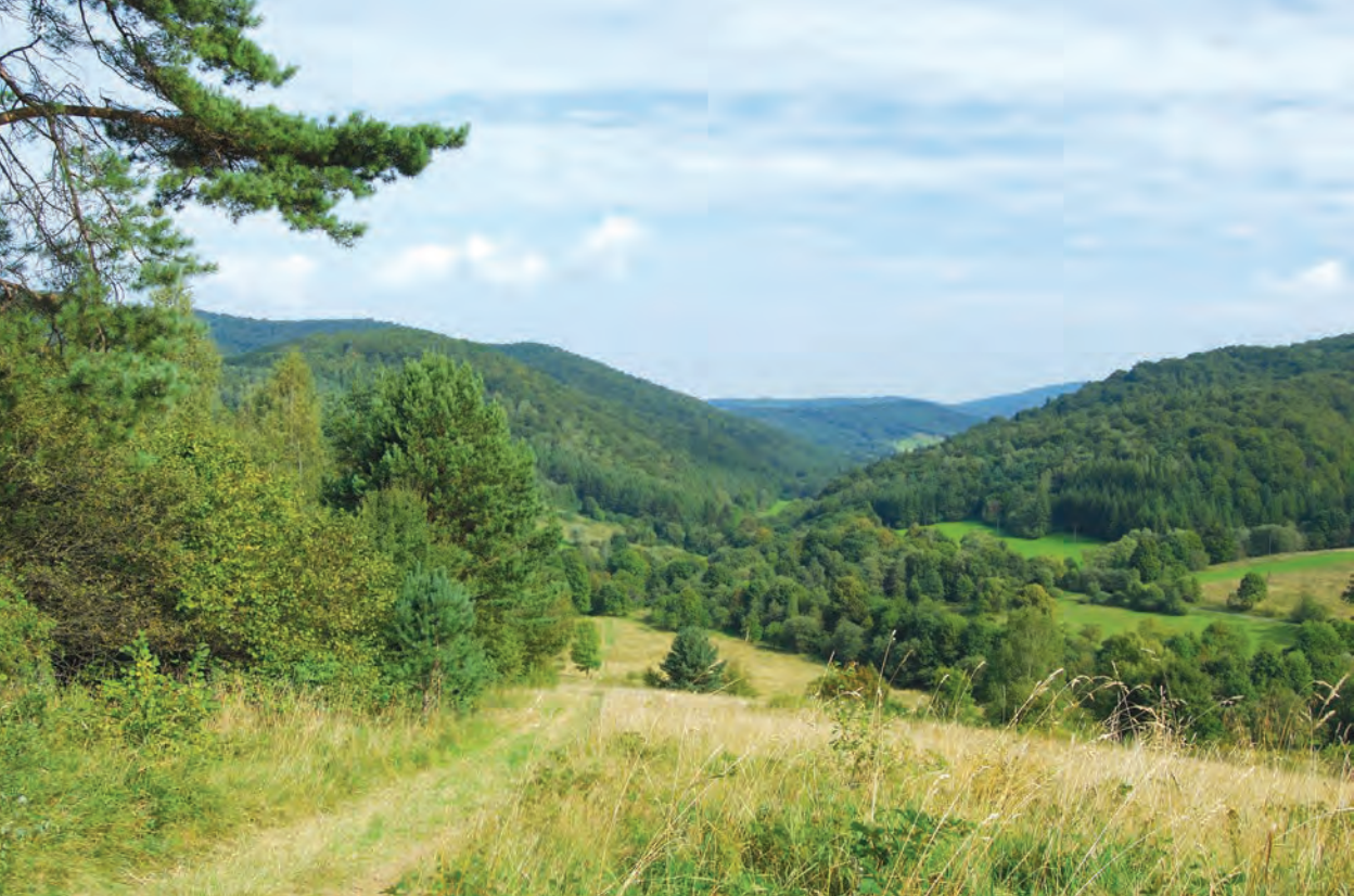
Magurski Park Narodowy, Kiczera Żydowska - Widok z Wysokiego, Polska

około 4500 gatunków. Dominują bezkręgowce (około 4000) z 1500 gatunkami chrząszczy i 700 motyli. Wśród 188 kręgowców najliczniej występują ptaki (127 gatunków). Na terenie parku żyją 2 gatunki ryb, 11 płazów, 5 gadów i około 50 ssaków. Spośród dużych ssaków należy wymienić niedźwiedzia brunatnego ( Ursus arctos arctos ), rysia ( Lynx lynx ) i wilka ( Canis lupus ).