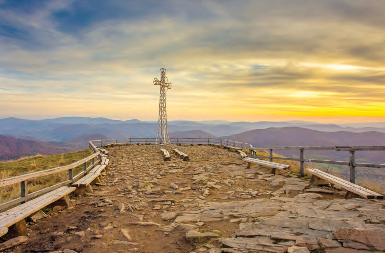
Tarnica, Bieszczady, Polska

o demokratyzacji edukacji i upowszechnieniu dostępu do niej. Ale w debacie tej nie zabrakło głosów, że państwo, które finansuje edukację, potrzebuje także elity, zdolnej do rządzenia i budowania pomyślności narodu i państwa. Te dwie filozofie myślenia pogodzone później w ustawach jędrzejewiczowskich z 1932 i 1933 roku. Ówczesnie ustawy te były zaliczane do najlepszych reform edukacji w Europie, chociaż do dziś są przez wielu krytykowane. Dlatego też współczesnym reformatorom szkolnictwa wyższego zadedykuję słowa marszałka Józefa Piłsudskiego wypowiedziane w 1921 roku w Uniwersytecie Warszawskim. Mówił on o podwójnym zadaniu uczelni: dostarczeniu narodowi i państwu fachowców oraz o nauce antyutylitarnej, jako czystej nauce, tworzącej „wyższe wartości ludzkiego ducha”. Ale bez tworzenia „wyższych wartości ludzkiego ducha” nie można wypełnić zadania pierwszego, czyli kształcenia fachowców. Może w tych słowach Marszałka powinna zawierać się społeczna odpowiedzialność uniwersytetu.