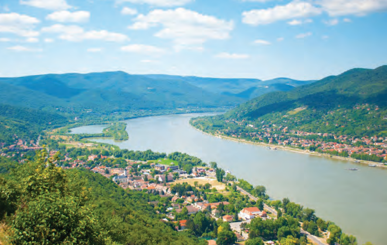
Zakole Dunaju, Węgry