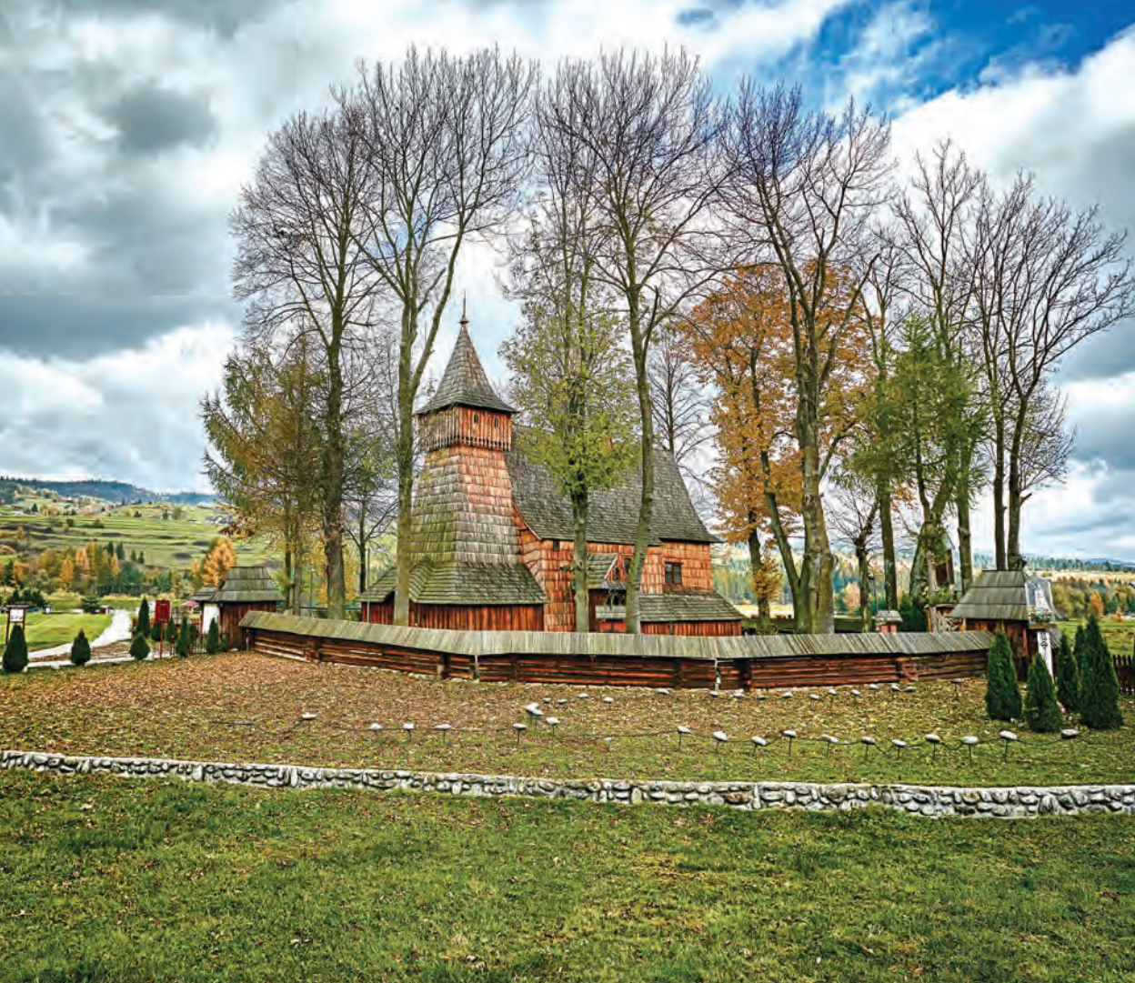
Kościół pw. św. Michała Archanioła, Dębno Podhalańskie, Polska

Inni mogą uczyć się od nas pomysłowości i elastyczności, a my możemy i powinniśmy uczyć się od innych budowania struktur i przestrzegania procedur. Myślę, że z jednej strony to nasz największy atut, a z drugiej strony największa słabość. Można powiedzieć, że nie da się tego połączyć, ale właśnie naszym zadaniem jest ten „ogień z wodą” – uporządkowanie z kreatywnością – połączyć.