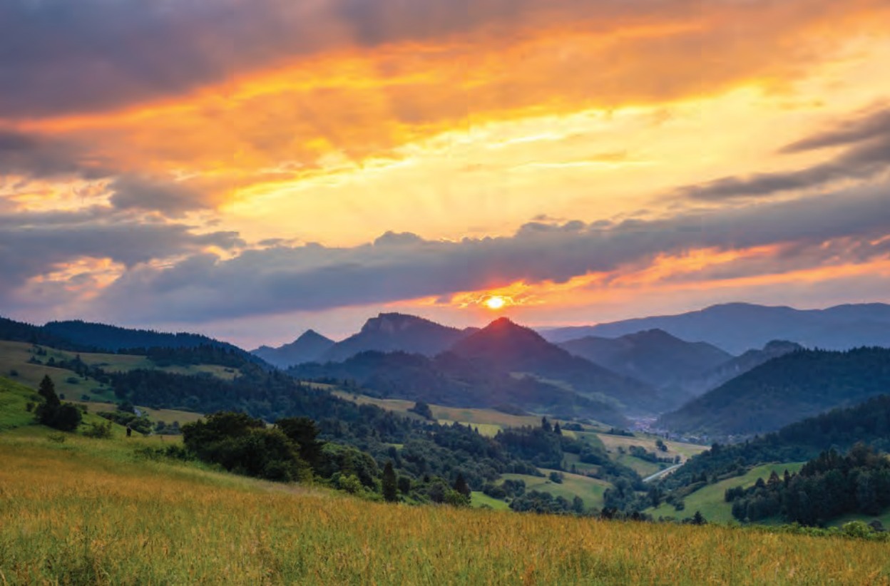
Pieniński Park Narodowy, Słowacja

regionem turystycznym. Wraz z rozprzestrzeniającą się bezładnie zabudową coraz to nowe tereny wymagają budowania kosztownej infrastruktury. Niszczony jest bezpowrotnie krajobraz, na nowe obszary wkracza antropopresja, kurczą się areale zasiedlone przez cenną roślinność i faunę.