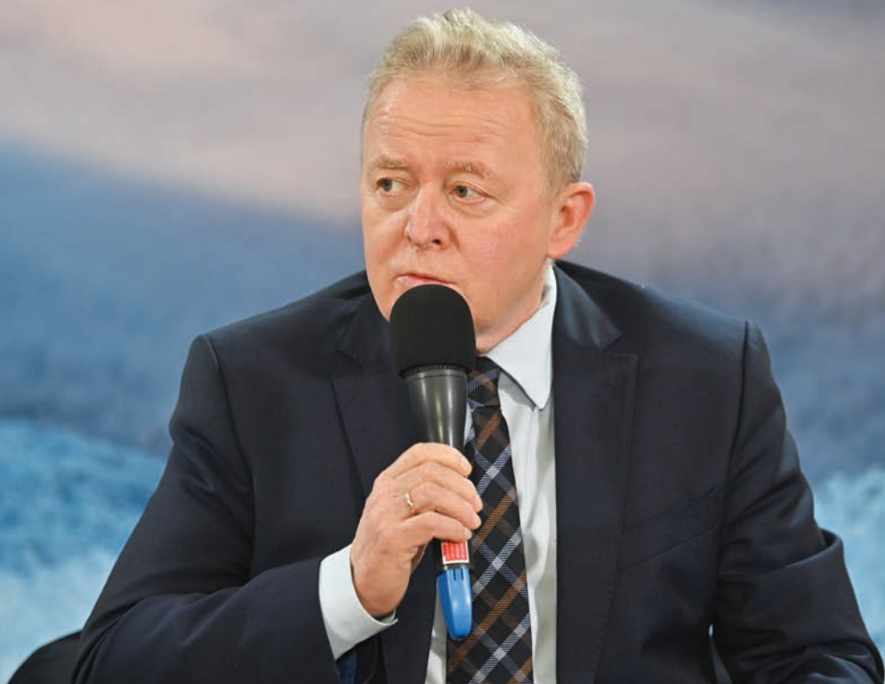
Janusz Wojciechowski – komisarz UE ds. rolnictwa

6,1 proc. – przez 5 lat udało się zatem podwoić obszary ekologiczne (wcześniej bowiem wskaźnik ten wynosił 3 proc.). Zsolt Feldman zaznaczył, że Węgry chcą utrzymać zrównoważony rozwój i do 2030 roku znów podwoić te obszary. Cel jest możliwy do wykonania, ale konieczne jest stworzenie do tego odpowiednich warunków. Najważniejsza jest wiedza, która pomoże w racjonalnym gospodarowaniu ekologicznym.