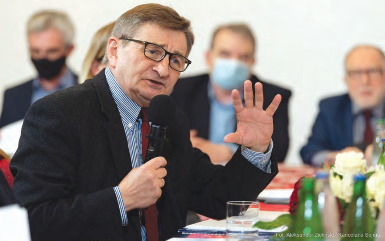
Marek Kuchciński – przewodniczący Komisji Spraw Zagranicznych Sejmu RP

Podczas spotkania zwrócono uwagę na różnorodność środowisk, jakie od lat zrzesza konferencja „Europa Karpat” – jest to bowiem miejsce spotkań polityków z państw Europy Środkowej i Wschodniej, intelektualistów środkowoeuropejskich, karpaccich działaczy państwowych i samorządowych, przedstawicieli organizacji pozarządowych oraz ekspertów z różnych dziedzin; środowisk, które łączy potrzeba poszukiwania recepty na funkcjonowanie między wielkimi imperiami Wschodu i Zachodu, jak również przekonanie o wyjątkowości tego regionu. Wspomniano o dotychczas przyjętych na konferencjach inicjatywach i dokumentach, m.in. o Strategii karpacciej, Uniwersytecie Karpaccim, Collegium Carpathicum, oraz o idei wydania encyklopedii karpacciej.