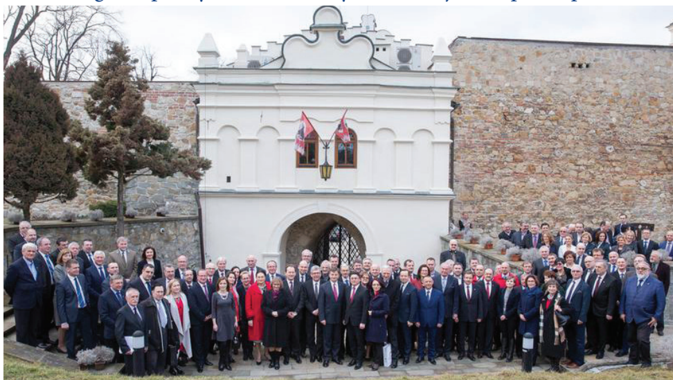
Konferencja Europa Karpat na Zamku Kazimierzowskim w Przemysłu, luty 2016 r.

Dzięki aktywnemu wspieraniu przemyskich inicjatyw o znaczeniu międzynarodowym i ogólnopolskim informacje o nich dotarły do milionów użytkowników mediów klasycznych i elektronicznych. To w Przemysłu organizowane są spotkania na międzynarodowych szczeblach – prezydów parlamentów (Bundestag, Grupa Wyszehradzka) czy konferencja Europa Karpat.