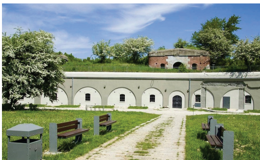
Fort XI Duńkowiczki