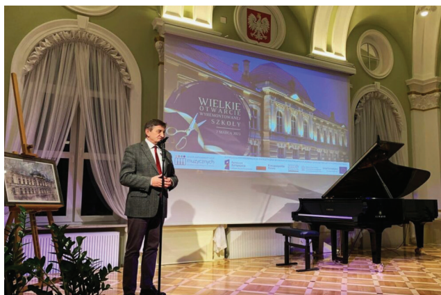
Otwarcie wyremontowanej Szkoły Muzycznej, luty 2023 r.

ok. 27 mln zł – ochrona zabytków, w tym remonty ulic i kamienic oraz prace konserwatorskie przy kościołach – renowacje elewacji, ołtarzy, obrazów (z programów ministerialnych, budżetu Wojewódzkiego Konserwatora Zabytków i województwa)