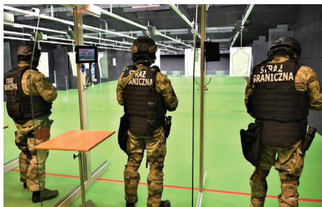
Strzelnica w Bieszczadzkiem Oddziale Straży Granicznej, luty 2020 r.

w urzędach i skuteczną walkę z mafiami VAT-owskimi. Rozwinęliśmy e-administrację (usługi, dokumenty, rozliczanie PIT)