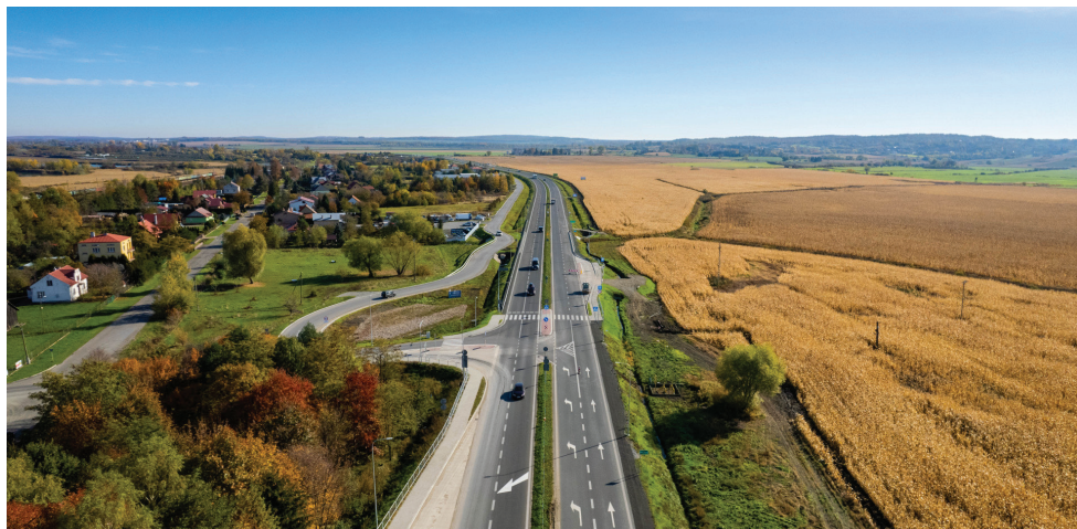
Rozbudowana droga krajowa 28 Przemyśl-Medyka

72 mln zł – z Programu Inwestycji Strategicznych PiS: