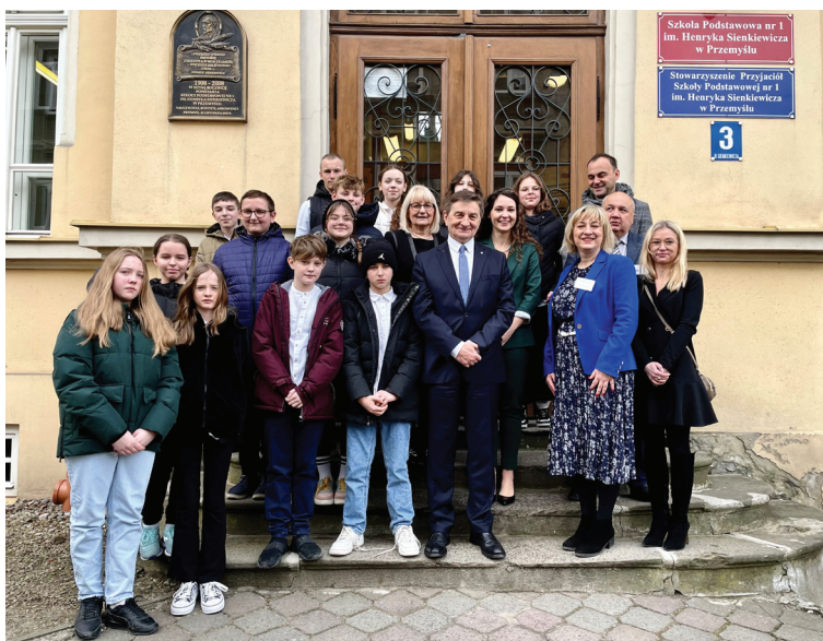
Wizyta ministra Marka Kuchcińskiego w Szkole Podstawowej nr 1 im. Henryka Sienkiewicza, luty 2023 r.

9,5 mln zł – wyprawka szkolna dla ok. 6 tys. uczniów rocznie (2018–2022)