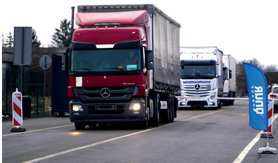
Przejście graniczne Malhowice-Niżankowice otwarte dla pojazdów ciężarowych

105 mln zł – budowa przejścia granicznego Malhowice-Niżankowice, o które starania trwały od lat 90., a nasiliły się od 2001 r., gdy Marek Kuchciński został posłem na Sejm RP. Przejście (otwarte 13.02.2023 r., dla ruchu ciężarowego) zapewni 21 miejsc pracy, a w pełnym wymiarze (ruch osobowy i towarowy) – 100 etatów