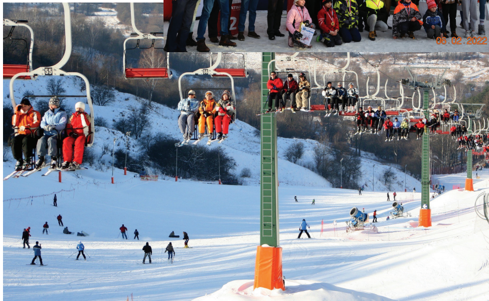
Stok narciarski w Przemyslu

80 tys. zł – wsparcie Klubu Polonia Przemysł