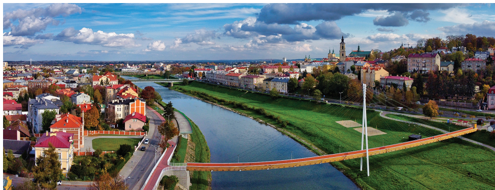
San, kładka rowerowa Green Velo

1,5 mln zł – remont wałów przeciwpowodziowych na Sanie