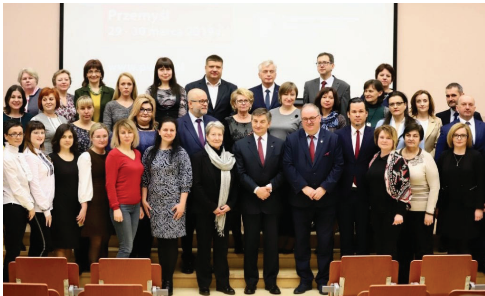
PWSW: I Kongres Polskiej Oświaty na Ukrainie, marzec 2019 r.

22 mln zł – inwestycje w Państwowej Akademii Nauk Stosowanych (do 2022 Państwowa Wyższa Szkoła Wschodnioeuropejska): wyposażenie pracowni w Instytucie Nauk Technicznych oraz Instytucie Sztuk Projektowych, adaptacja pomieszczeń, przebudowa poddasza Domu Studenta, zwiększenie dostępności e-usług, poprawa jakości kształcenia, zakup nowoczesnego wyposażenia