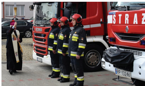
Poświęcenie wozów strażackich w Komendzie Miejskiej Państwowej Straży Pożarnej w Przemyśle, październik 2017 r.