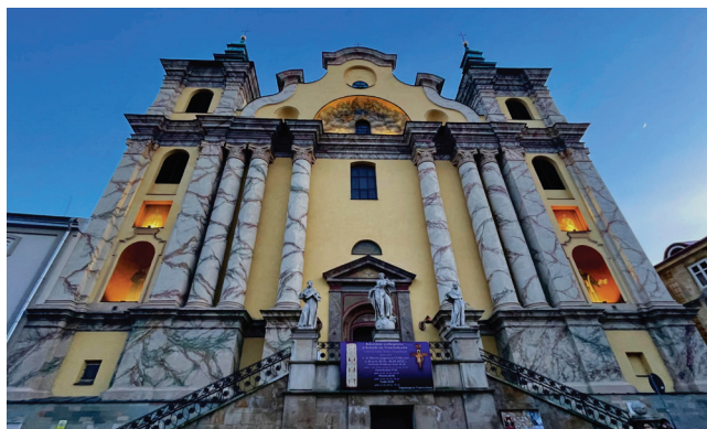
Kościół Ojców Franciszkanów w Przemyślu

5,2 mln zł – z Programu Odbudowy Zabytków na: remont Archikatedry Przemyskiej, Zamku Kazimierzowskiego, I Liceum Ogólnokształcącego, Miejskiego Domu Kultury oraz Starostwa Powiatowego (2023)