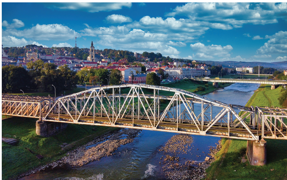
Budowany nowy most kolejowy w Przemysłu

60 mln zł – budowa mostu kolejowego na Sanie w Przemysłu (dla szybkich kolei) pomiędzy dwoma starymi mostami, z zachowaniem zabytkowego krajobrazu miasta. Powstanie kładka pieszo-rowerowa i Muzeum. Działanie to podjęto z inicjatywy posła Marka Kuchcińskiego podczas spotkania u ministra infrastruktury 13 kwietnia 2021 r. Nowy sześcioprzęsłowy most o długości blisko 200 metrów będzie swoim kształtem nawiązywał do dawnej konstrukcji