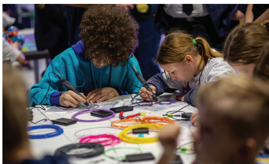
Zajęcia z rządowym programem Laboratoria Przyszłości

przeznaczyliśmy na pomoc polskim rodzinom, wsparcie dla dzieci – 500 plus – i seniorów – wypłatę 13. i 14. emerytury dla wszystkich emerytów i rencistów, dofinansowanie posiłków w szkołach i dowożonych do osób starszych oraz zabezpieczenie Polaków przed podwyżkami