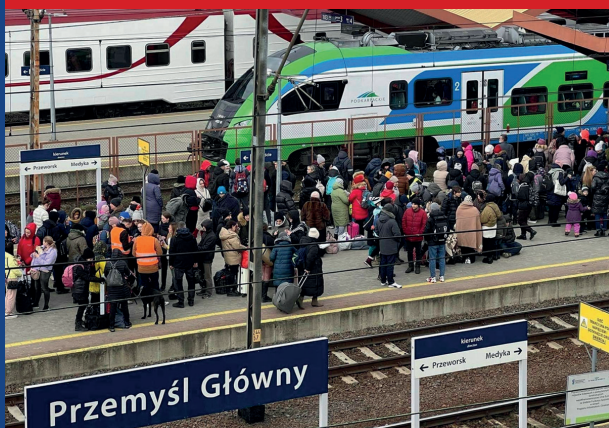
Dworzec kolejowy w Przemysłu – obsługa uchodźców